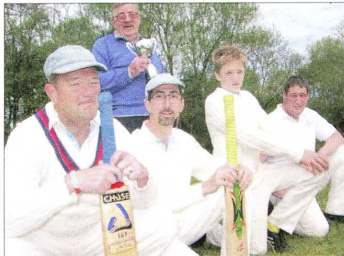
Lèves, samedi. Les Anglais de Nailsworth avaient tous revêtu la tenue traditionnelle du joueur de cricket. So british!

Les représentants sportifs de la délégation britannique - 65 habitants de Nailsworth - avaient pourtant préparé cette rencontre au sommet, en n'oubliant pas, dans leur suitcase, les pantalons de toile écrue, les gilets col en V et les casquettes bleu pâle caractéristiques de cette discipline d'essence nobiliaire, creuset historique du plus populaire sport de batte, le base-ball.